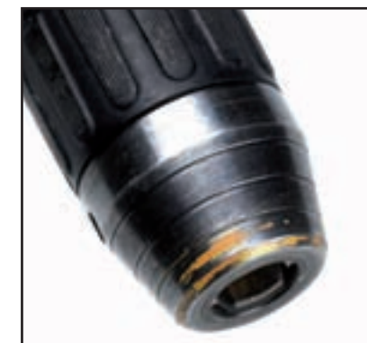
Usure causée par l'utilisation de la perceuse avec le mandrin en contact avec la maçonnerie ou d'autres surfaces dures