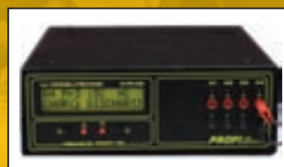
Testeur de batterie Pegasus

Les batteries doivent être testées à l'aide du testeur de batterie Pegasus disponible auprès de DEWALT. L'échange de batterie en garantie ne doit être effectué que par des agents en utilisant les processus approuvés par DEWALT et l'équipement de test. Veuillez contacter votre responsable de service pour plus de détails.