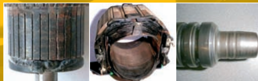
Erbout fondu - surchargé

Les exemples ci-dessous ne sont pas couverts par la garantie :