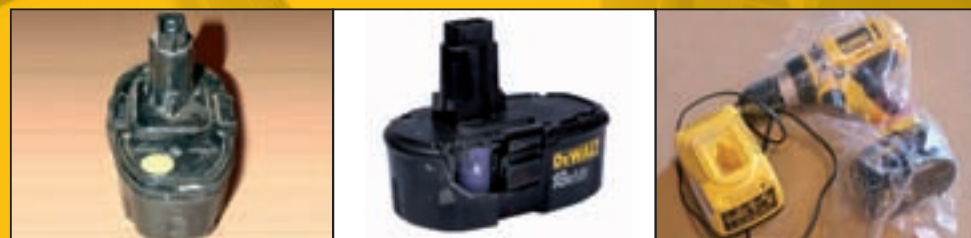
L'utilisateur a tenté d'ouvrir la batterie

S'il est évident que ces consignes n'ont pas été respectées, tous les dégâts qui résultent à la batterie ou toutes les faibles performances ne sont pas couverts par la garantie.