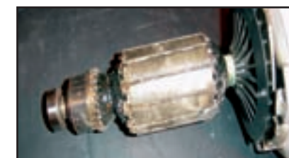
Induit grillé (surchargé)

Pour assurer une longue durée de service, les moteurs sont équipés d'un ventilateur de refroidissement. L'efficacité de ce système de refroidissement est directement liée à la vitesse de l'induit. Lorsque la contrainte placée sur un moteur augmente, davantage d'énergie est requis pour maintenir le régime nominal. En cas de contrainte prolongée, le régime du moteur chute et l'effet de refroidissement diminue rapidement. La température du moteur augmente ensuite et peut provoquer une surchauffe critique.